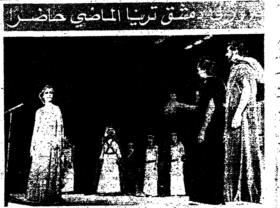
تواصل بيروت تلبية مسرحية «بئرا» على مسرح الميراث الدولي دمشق ، بنجاح كبير . ويصف مؤيد «الاور» الى دمشق ، فخر الجمهور بالمسرحية ويصفه فيروز : لقد اكتسبت الناس الاقرباء من الرجال ، اما الشباب والشابات فظهر على انهم يزين الجمع . وقال احمد المشادين : الشان في لبنان حزين ، ولكنه يستند الناس . وفي المسيرة فيروز في مشهد من المسرحية (التحقق على الصفحة ٧)

مناقشة تريا الماضي حاضر تواصلت المناقشة في الموضوعات التي تناولها الاجتماع في بيروت ، وذلك في اطار اللقاء الذي اقامته اللجنة الوطنية الفلسطينية للتربية والثقافة والاعمال . وقد شارك في الاجتماع ممثلون من مختلف المنظمات الفلسطينية ، ورجال من المؤسسات التعليمية والثقافية . وكانت المناقشة تتركز على اهمية التمسك بالقرابة الفصحية ، وعلى ضرورة العمل على توحيد الجهود في مواجهة التحديات التي تواجه الشعب الفلسطيني .